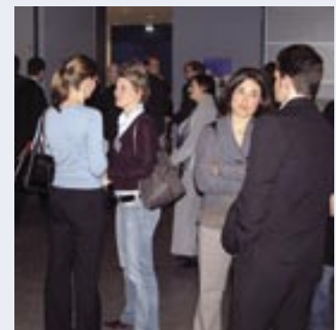
Angeregte Gespräche nach Diskussionsende